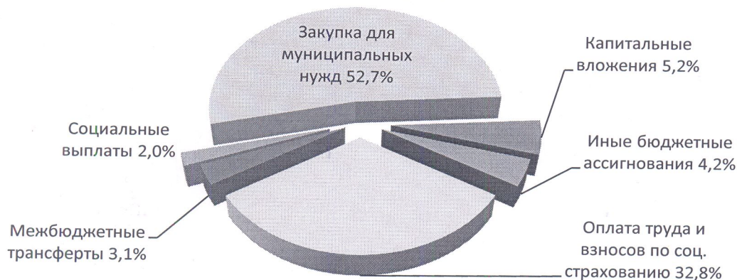
Рис. 3. Экономическая структура расходов бюджета Приволжского сельского поселения за 9 месяцев 2024 года

Экономическая структура расходов бюджета поселения характеризуется следующими показателями (рисунок 3).